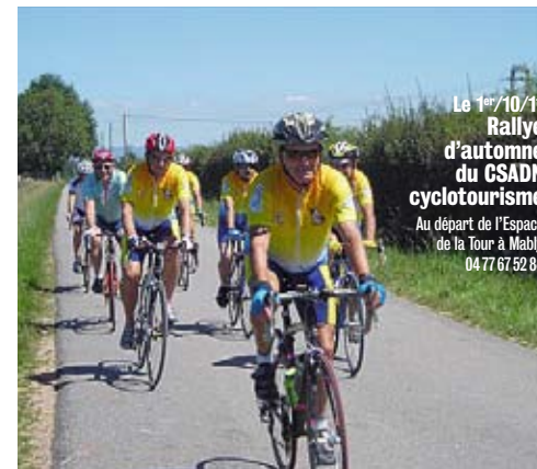
Le 1 er /10/11 Rallye d'automne du CSADN cyclotourisme Au départ de l'Espace de la Tour à Mably 04 77 67 52 84

Le 2/10/11 Fête du sport pour tous Complexe sportif Malleval/Fontalon 04 77 71 25 81 ou 04 77 44 42 52 Le 9/10/11 Randonnée des Monts de la Madeleine Au départ de La Loge des Gardes 04 77 65 93 84 ou 04 77 71 04 30