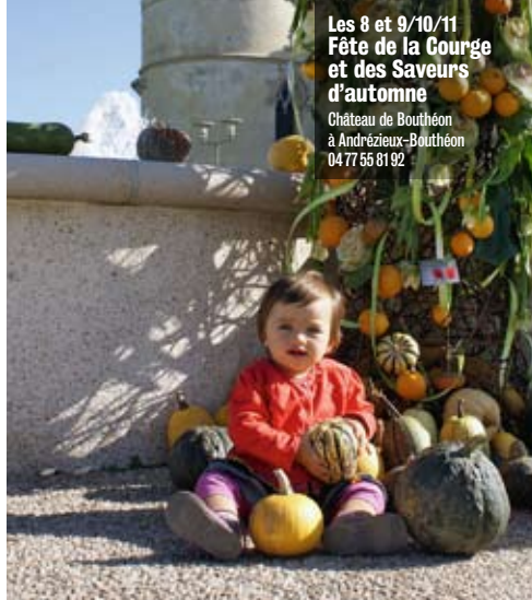
Les 8 et 9/10/11 Fête de la Courge et des Saveurs d'automne Château de Bouthéon à Andrézieux-Bouthéon 04 77 55 81 92

Le 18/09/11 16 e marche du Sou des écoles 04 77 54 95 77 ou 06 65 75 63 33