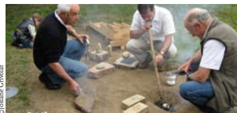
Essai de fonte d'antimoine lors d'un atelier.

L'association La Mine d'or de Bissieux profite des Journées européennes du patrimoine et de la Fête de la Science, pour vous présenter son site minier grâce à des visites et des ateliers.