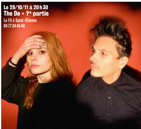
Le 29/10/11 à 20 h 30 The Do + 1 re partie Le Fil à Saint-Étienne 04 77 34 46 40

Le 11/09/11 Vide-grenier Dans les rues du village médiéval 06 78 13 08 89