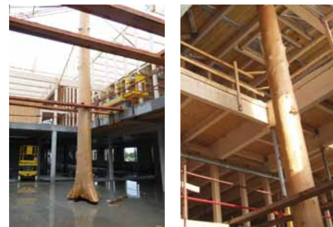
Le bois : matériau privilégié

La demi-pension est indépendante, positionnée au Nord de l'ensemble et s'ouvrant largement au Sud pour profiter de l'ensoleillement. La façade vitrée est protégée par un large auvent.