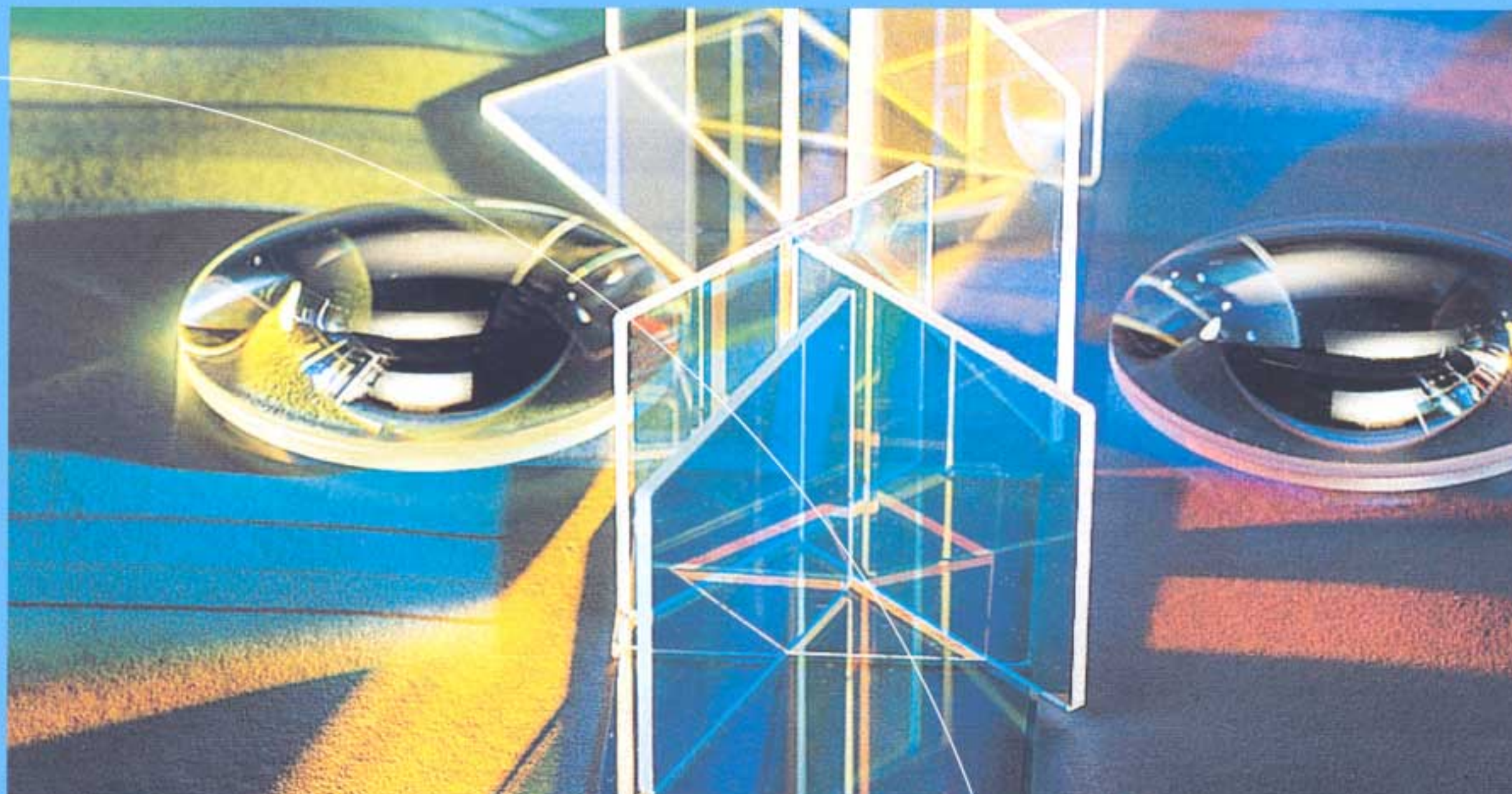
schéma de développement

Confrontée à des enjeux majeurs d'attractivité, de diversification et de renouvellement de son tissu, l'économie ligérienne doit jouer de ses capacités d'adaptation, d'innovation et de coopération. Inscrite à la fois dans la dynamique de la région urbaine de Lyon et dans celle du Massif central, forte de potentiels économiques encore sous exploités (tourisme, services) et de savoir-faire reconnus, elle dispose de tous les atouts pour réussir sa mutation. Conscient que la force d'une économie repose essentiellement sur le dynamisme de ses acteurs, le Conseil général de la Loire entend stimuler la capacité d'innovation du territoire, tant en termes de technologies que de nouvelles activités. Il souhaite aussi conforter la qualité de son accueil économique et développer l'accompagnement offert aux entreprises pour leurs projets de développement.