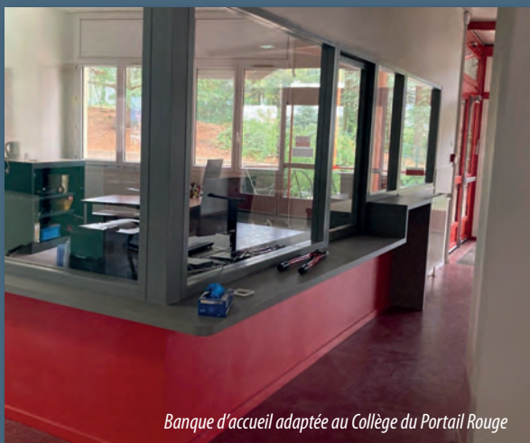
Banque d'accueil adaptée au Collège du Portail Rouge

Les collèges Jacques Brel à Chazelles-sur-Lyon, Louise Michel à Rive-de-Gier et Le Portail Rouge à Saint-Étienne ont bénéficié de nouveaux aménagements pour les rendre accessibles à tous les publics.