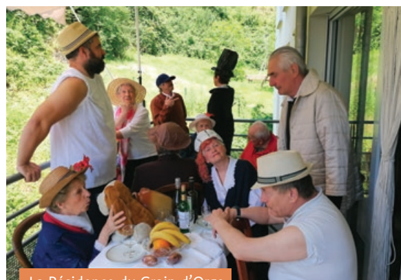
La Résidence du Grain d'Orge

La Résidence du Grain d'Orge de Saint-Priest-en-Jarez a participé à un concours artistique mêlant photo, peinture et lien social. Les habitants ont rejoué la scène de la toile : « Déjeuner des canotiers » d'Auguste Renoir par la Résidence le Grain d'Orge.