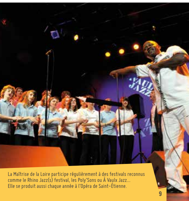
La Maîtrise de la Loire participe régulièrement à des festivals reconnus comme le Rhino Jazz(s) festival, les Poly Sons ou À Vaulx Jazz... Elle se produit aussi chaque année à l'Opéra de Saint-Étienne.