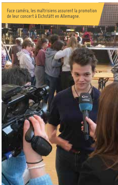
Face caméra, les maîtrisiens assurent la promotion de leur concert à Eichstätt en Allemagne.