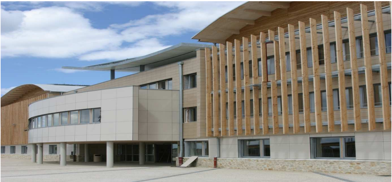
© Conseil général de la Loire