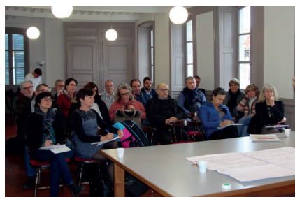
Atelier n°2 : parcours résidentiels et besoins particuliers. Cet atelier est orienté sur les ménages et l'approche sociale liée à l'habitat.