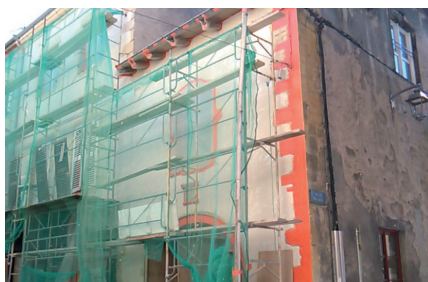
Atelier n°1 : attractivité des bourgs centres. Il porte sur le logement/bâti et les aménités de la commune.

Deux ateliers ont été organisés de façon simultanée. Chacun a porté sur une problématique suffisamment large pour être transversale et pluri-thématique. En fin de matinée, les rapporteurs ont restitué une synthèse de leur atelier respectif auprès de l'ensemble des participants.