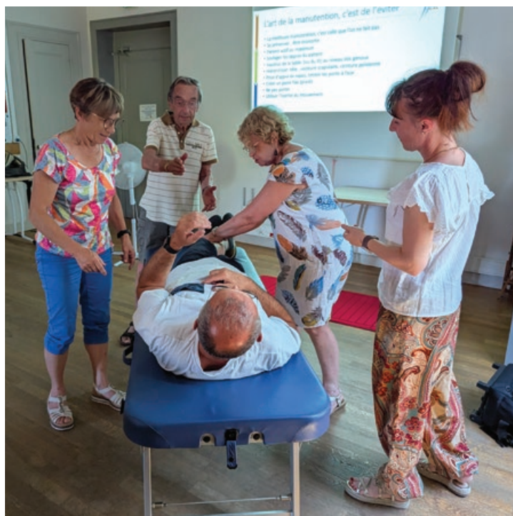
Réponses : a, b, d, e