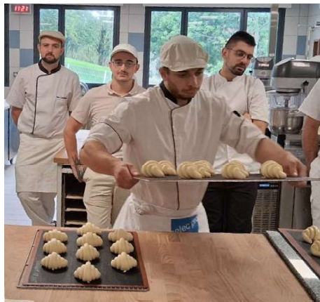
Dix boulangers de la région s'affrontaient dans le concours du meilleur croissant et pain au chocolat.

Ils étaient dix, un par département, réunis ce mardi 22 septembre au lycée hôtelier pour une épreuve de cinq heures. Objectif : séduire le jury avec leurs croissants, pains au chocolat et décrocher une place en finale nationale.